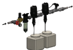
Installation avec double injection à distance