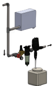
Installation avec réservoir d'alimentation