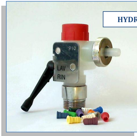
HYDRO ML 970018.PVDF